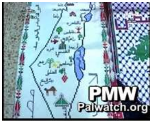
[הטלוויזיה הפלסטינית (פת"ח), 02/06/2010]

בקטע העוסק במורשת הפלסטינית בתכנית אקטואליה שבועית בשם "פלסטין הבוקר הזה", בחרה הטלוויזיה הפלסטינית להתמקד במפה הקומה המבטלת את קיומה של ישראל.