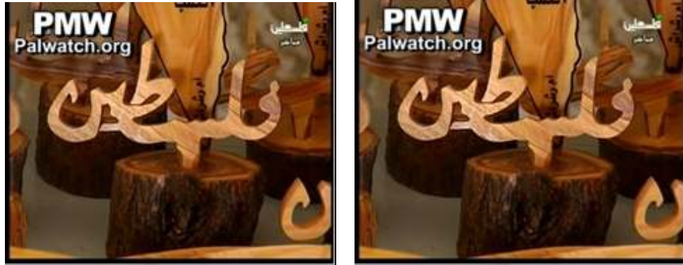
[הטלוויזיה הפלסטינית (פת"ח), 27/06/2010]

בקטע טלוויזיוני העוסק באומן גילוף פלסטיני, הטלוויזיה הפלסטינית בחרה להתמקד ולהציג דוגמאות מעבודות העץ שלו, בצורת מפת כל "פלסטין" המוחקת את ישראל. על כל אחת מתחריטי המפות המוצגים מופיע הדגל הפלסטיני ותמונה של יאסר ערפאת. המילה "פלסטין" מגולפת בתחתית המפה.